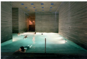
Thermes de Vals - Peter Zumthor

partout, dans les villes balnéaires, bien sûr, mais aussi dans des lieux plus inattendus, comme Versailles, où le spa du Trianon Palace est un must. Devant l'engouement du public, établissements thermaux et hammams en tout genre se sont multipliés, y compris dans le cœur des villes et on peut voir dans ce phénomène l'un des aspects du culte contemporain du bien-être. En 1996, l'inauguration des spectaculaires thermes de Vals, en Suisse, construits par l'architecte Peter Zumthor, a eu un retentissement international qui témoigne de l'intérêt du public pour ces temples dédiés aux plaisirs du corps.